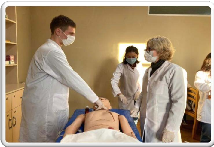
კოლეჯს შემუშავებული აქვს პერსონალის

კოლეჯის პროფესიულ მასწავლებლებსა და ადმინისტრაციის პერსონალს გააჩნია სასწავლო პროცესების დაგეგმვისა და მართვის დიდი გამოცდილება. კოლეჯი ხელს უწყობს მათი კვალიფიკაციის ამაღლებას, როგორც სასწავლებლის, ისე განათლების ხარისხის განვითარების ეროვნული ცენტრისა და სხვა ორგანიზაციების მიერ ორგანიზებული ტრენინგებისა და სამუშაო შეხვედრების საშუალებით.